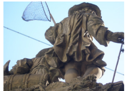
Figurengruppe Rückansicht 2006