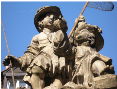
Ansicht vom Unteren Markt 2006

Die Wertigkeit und Ausdruckskraft erfordert maximalen Erhalt der vorhandenen Substanz unter konservatorischen und restauratorischen Gesichtspunkten. Die Bearbeitung ist sehr filigran und bedarf in hohem Maße Erfahrung mit dem Steinmaterial. Die vorgesehene Restaurierung soll in Kürze umgesetzt werden, so dass in der kommenden Brunnen-saison ab dem Frühjahr dieses für die Platzgestaltung so wichtige Denkmal in „altem neuem“ Glanz erstrahlt.