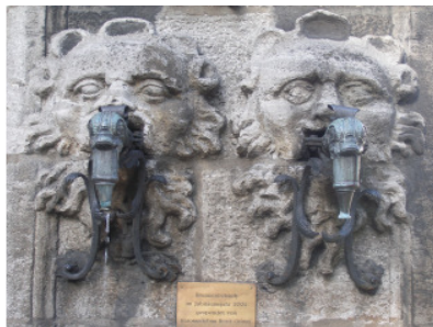
Löwenmäuler mit Wasserauslauf 2006