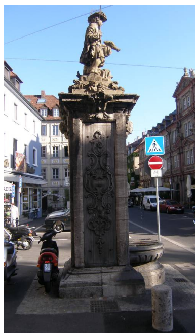
Fischerbrunnen am Fischmarkt, Karmelitenstraße