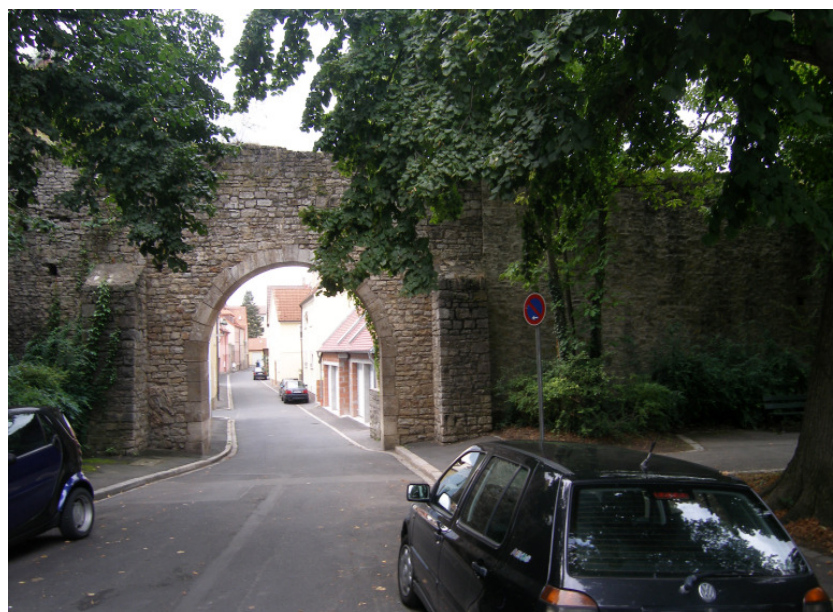
2.BA Werkingstraße, Tor am Unterer Weg 2006/2007