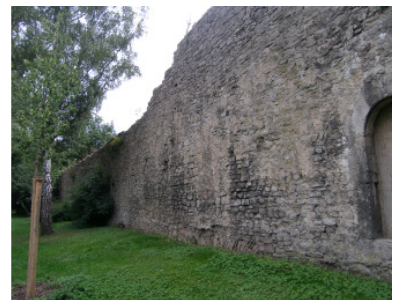
2.BA Klostergarten, Seilerstrasse 2006/2007