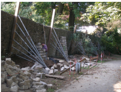
1.BA Klostergarten, Seilerstrasse 2005/2006

Nachdem der 1. Bauabschnitt der Gesamtmaßnahme, die Sanierung des stark einsturzgefährdeten Teilstücks im Bereich Seilerstrasse, Klostergarten bis Mitte des Jahres 2006 abgeschlossen wurde, ist die Fortführung der Restaurierungsmaßnahme mit Aufnahme der Arbeiten des nach Dringlichkeit ausgewählten 2. Bauabschnitts im Bereich Seilerstraße/Werkingstraße für 2006 / 2007 bereits in die Wege geleitet.