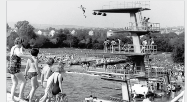
Das Dallenbergbad in den 50er Jahren