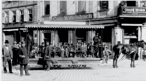
Die Würzburger Pferdebahn um 1900

Lassen Sie sich überraschen von der Faszination Technik in ihren Anfängen.