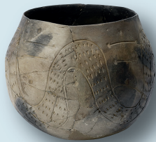
Illustration Titelseite: Tilman Wanke, Museum für Franken