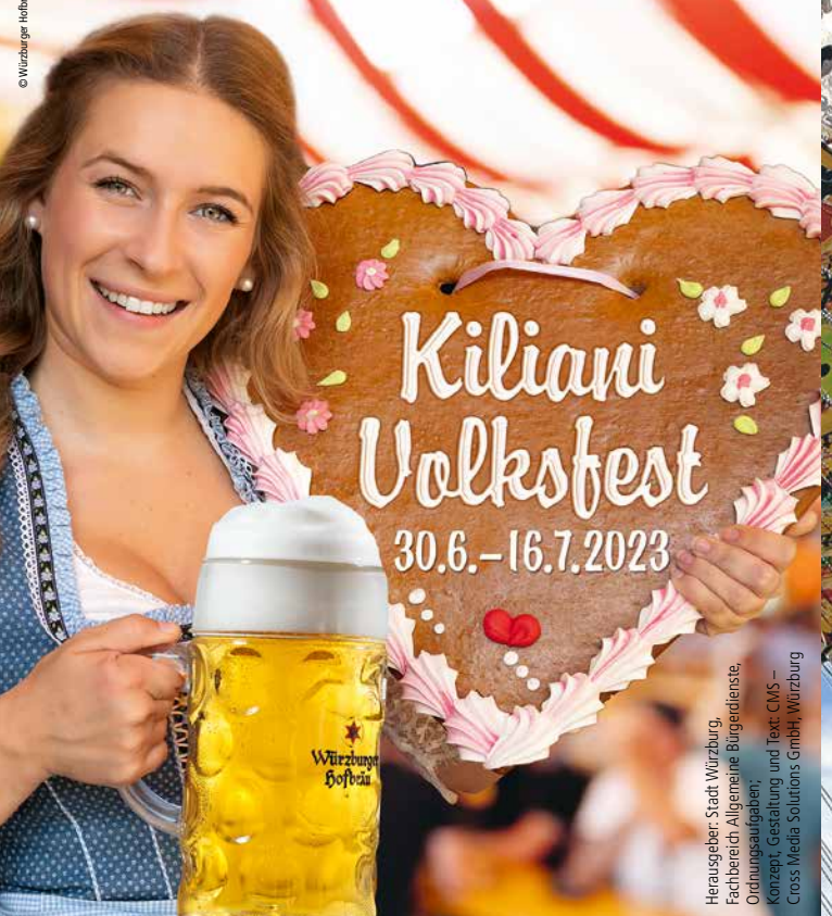
Herausgeber: Stadt Würzburg, Fachbereich Allgemeine Bürgerdienste, Ordnungsaufgaben; Konzept, Gestaltung und Text: CMS – Cross Media Solutions GmbH, Würzburg

Parallel zum Volksfest laden die Marktkaufleute wieder zur traditionellen Kilianimesse . Entdecken Sie beim Bummel über Würzburgs Marktplatz eine vielfältige Palette besonderer und nützlicher Dinge. Die Öffnungszeiten sind Montag–Freitag 9.00–19.00 Uhr Samstag 9.00–18.00 Uhr Sonntag 11.00–18.00 Uhr