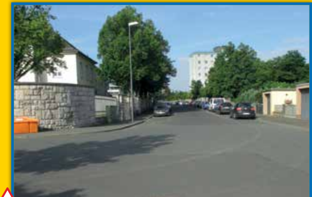
2 Richard-Wagner-Straße - Marianhillstraße

sehr hohes Verkehrsaufkommen, Fußgänger überqueren bei Rot