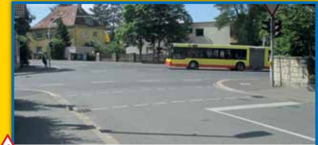
1 Rottendorfer Straße – Am Galgenberg – Richard-Wagner-Straße

sehr hohes Verkehrsaufkommen, Fußgänger überqueren bei Rot