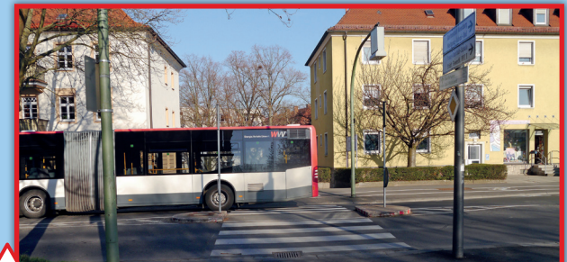
3 3 Zebrastreifen Wittelsbacherstr.

Parkende Autos auf dem Gehweg, die beim Rückwärtsfahren oft kleinere SuS übersehen, schlechte Einsicht in die Ulrichstraße, Lieferwagen, die die Sicht versperren