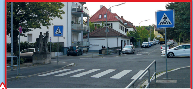
1 Friesstraße/ Von-Luxburgstraße:

Schlechte Sicht durch Parkende Autos auf dem Bürgersteig, chaotische Situation am Morgen und Mittag durch kurz parkende Autos, Autos die nicht am Zebrastreifen halten