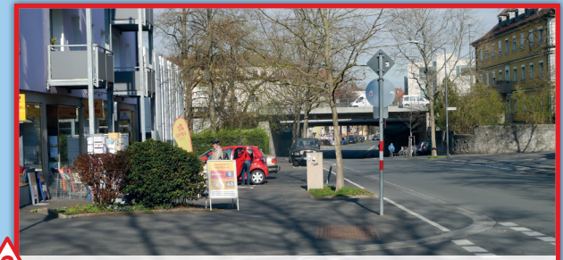
2 Seinsheimstr./ Ulrichstr. (Buntstift)

Schlechte Sicht durch Parkende Autos auf dem Bürgersteig, chaotische Situation am Morgen und Mittag durch kurz parkende Autos, Autos die nicht am Zebrastreifen halten