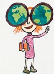
Illustration: © Antje von Stemm